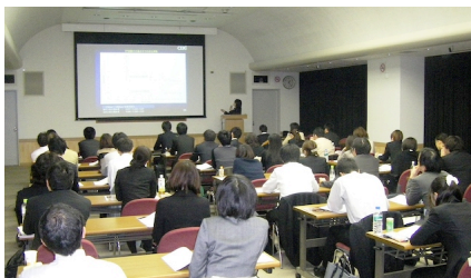
昨年 2013 年度の講義の様子

会 場 (株) 島津製作所東京支社 2 階イベントホール (東京都千代田区神田錦町 1-3, 電話: 03-3219-5588 (グローバルマーケティング部), 交通: ①小川町駅 (都営新宿線), 新御茶ノ水駅 (東京メトロ千代田線), 淡路町駅 (東京メトロ丸ノ内線) 下車徒歩 6 分, ②神田駅 (JR 山手線) 下車徒歩 12 分, http://www.an.shimadzu.co.jp/general/contact/map/tokyo.htm )